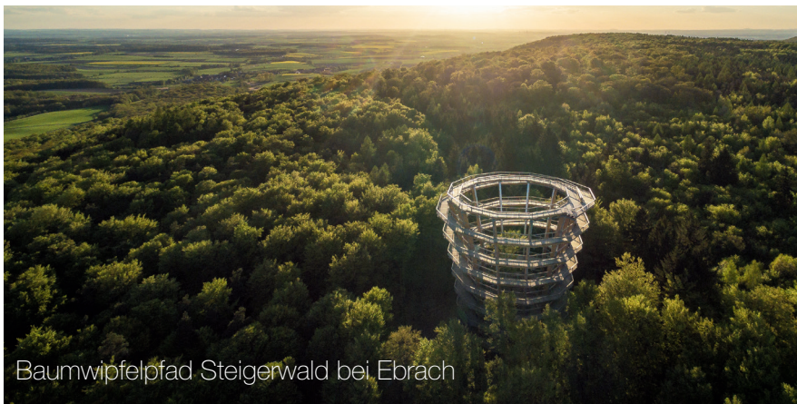
Baumwipfelpfad Steigerwald bei Ebrach